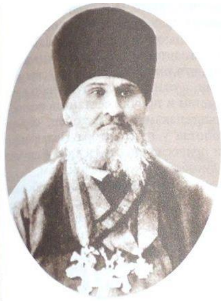
Александр Сизой (первый священник на Амуре)